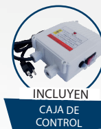
Mod. SQUALLI 1