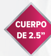
Mod. TRITONE 1/2